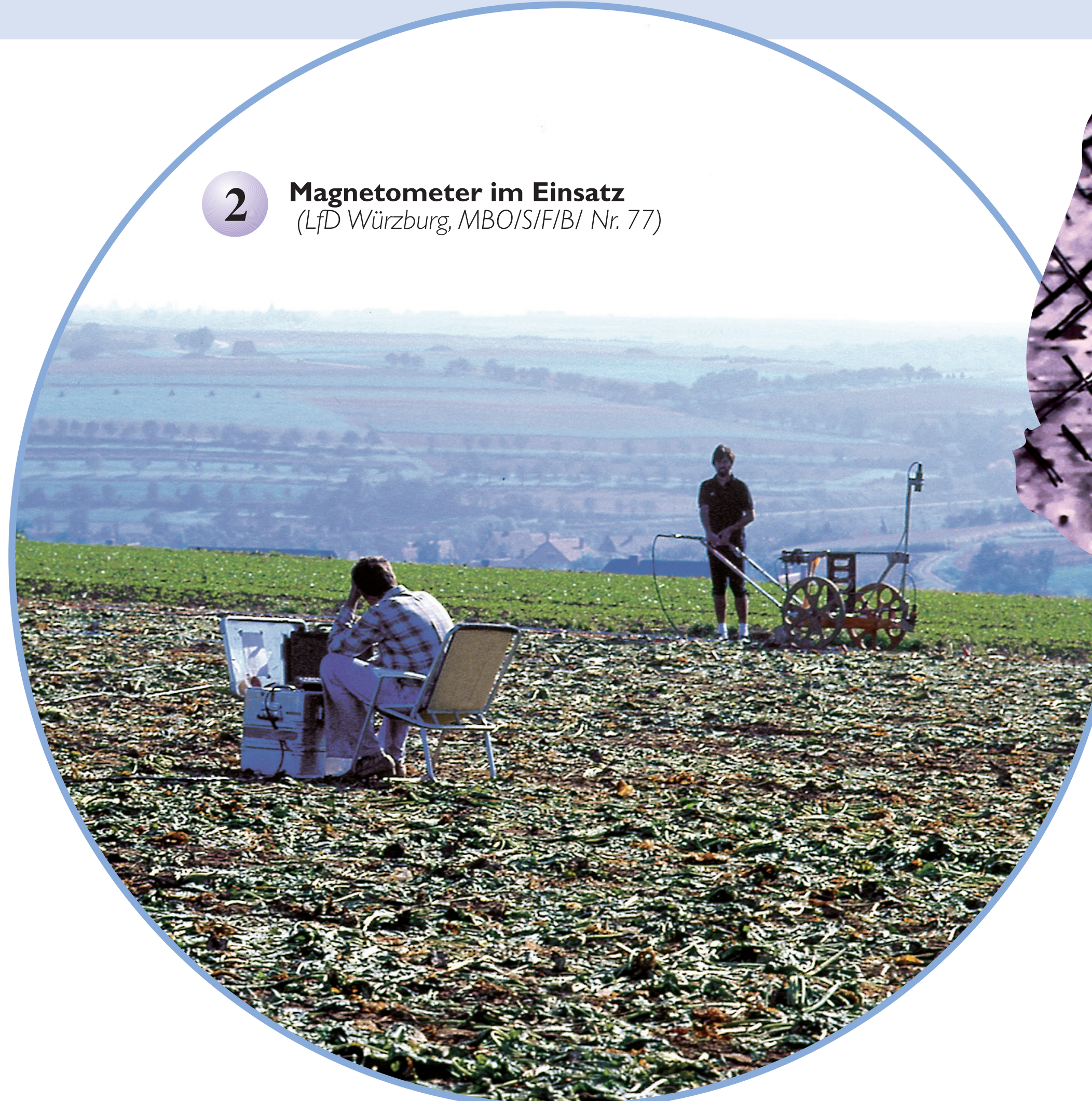
2 Magnetometer im Einsatz