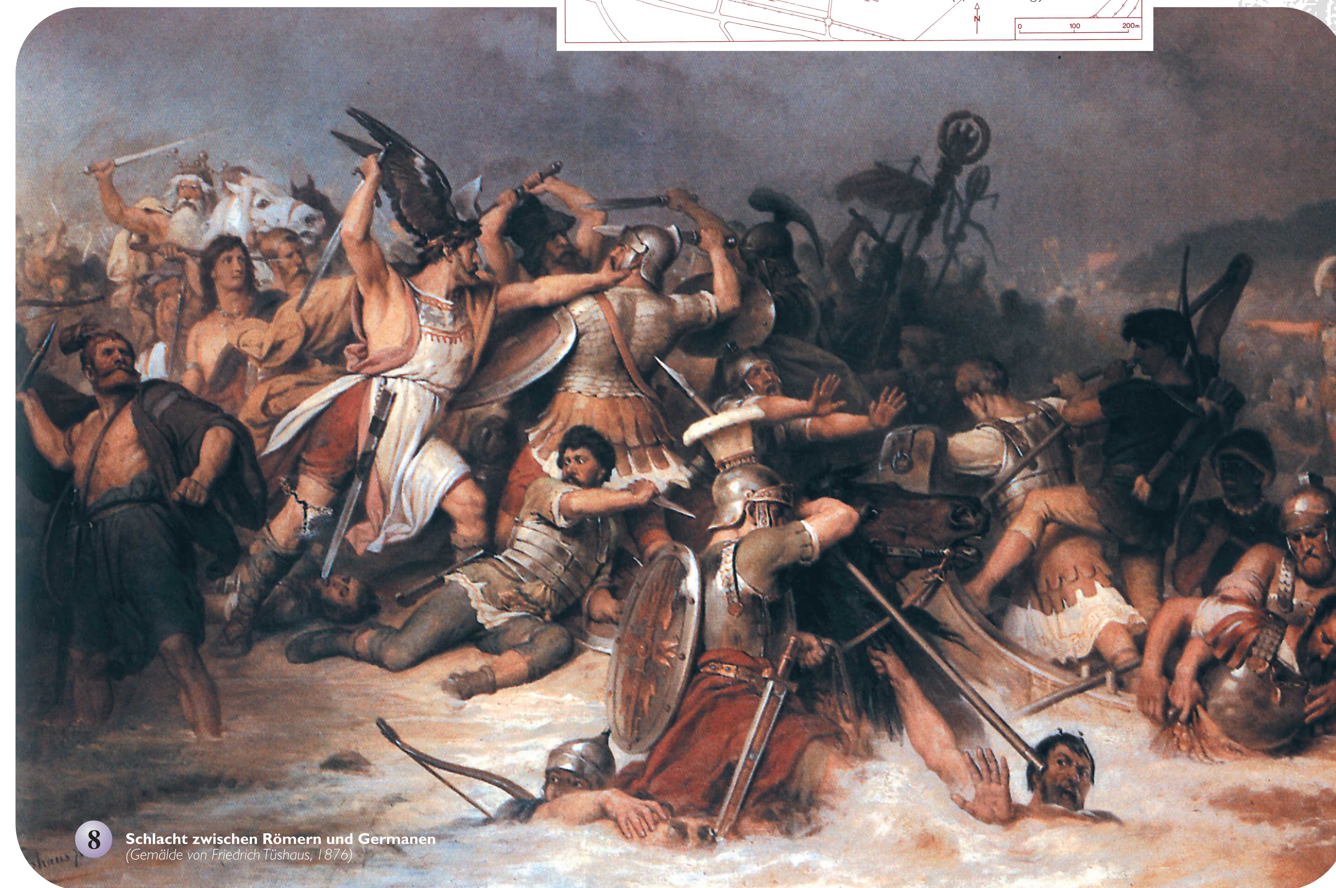
8 Schlacht zwischen Römern und Germanen (Gemälde von Friedrich Tschüssa, 1876)