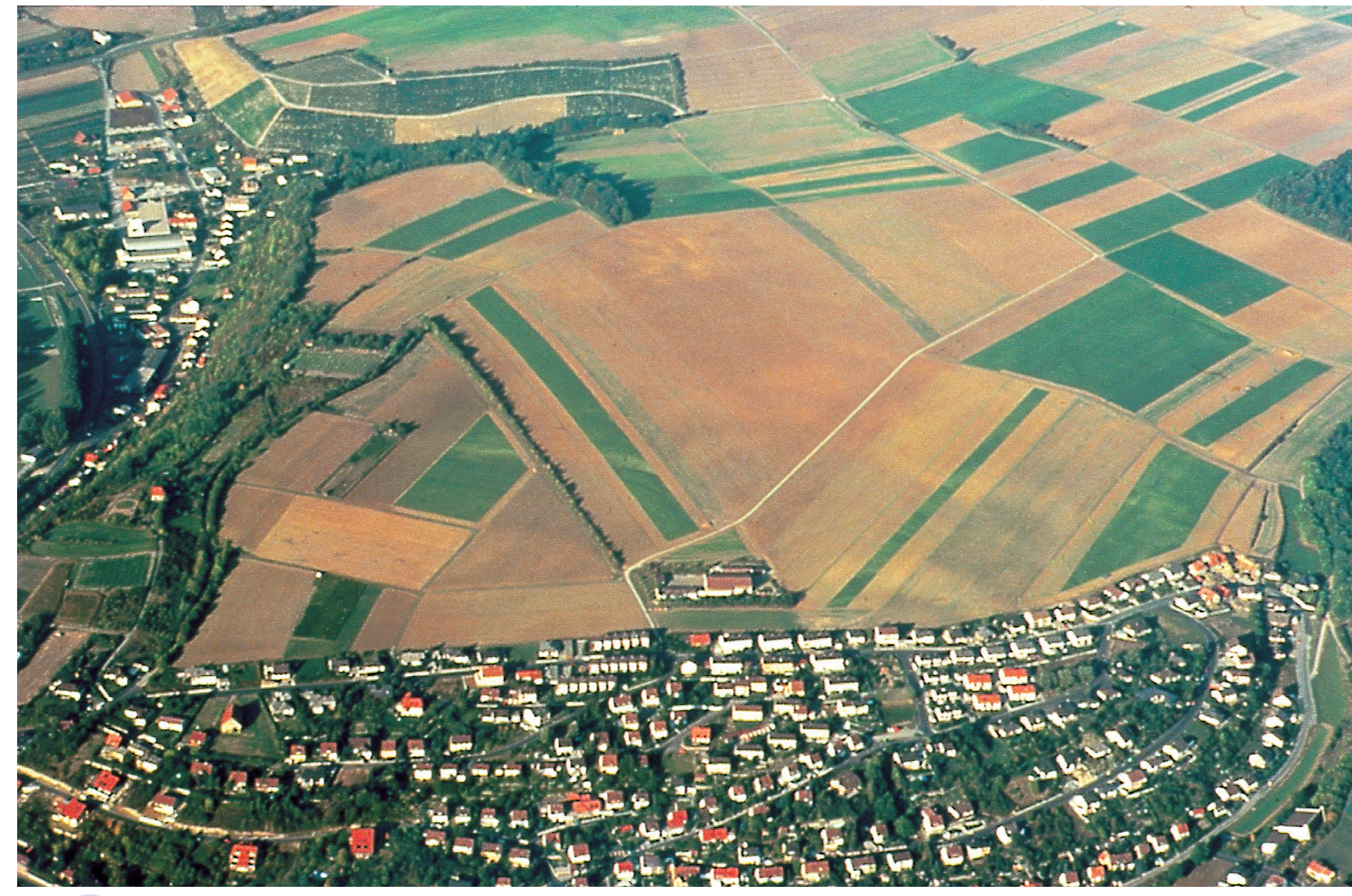
1 Luftbild vom Kapellenberg