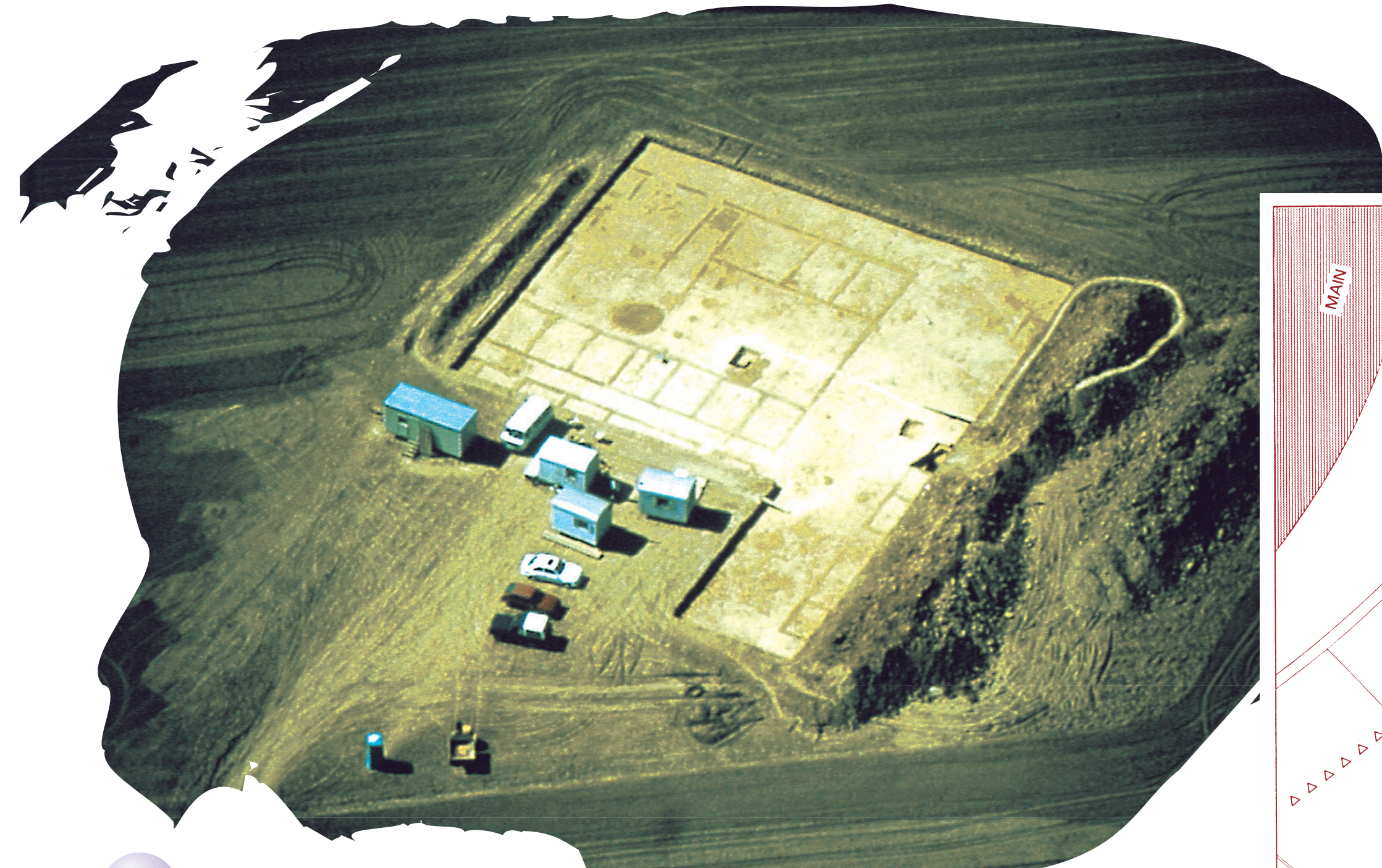
4 Verfärbungen im Boden aus der Luft gesehen (LfD Würzburg, Marktbreit 1991 Nr. 1353 F15)